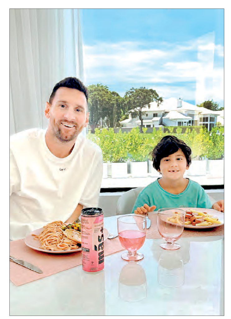
বাড়িতে ছেলের সঙ্গে লিও মেসি।